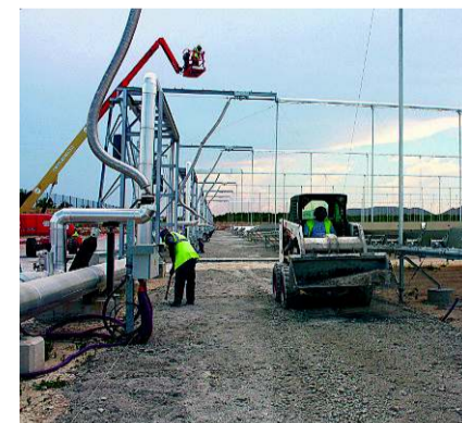
Auch im Solarfeld gehen die Arbeiten planmässig voran.

Die Ingenieurfirma Novatec, welche das Linear-Fresnel-Kraftwerk entwickelt hat, forscht parallel zum Bau in der direkt daneben liegenden Pilotanlage PE1 an der Weiterentwicklung. Ziel ist, etwa durch eine Verlängerung der Spiegelstrecken die Dampftemperatur von 270 auf 400 Grad zu steigern. «Wir hoffen, damit die Produktionskosten von 28 auf 20 Cents pro Kilowattstunde senken zu können», erklärt Steiner.