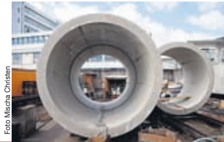
Röhrenwelt: Der Entwässerungskanal beim Novartis Campus steht vor dem Abschluss. > SEITE 23