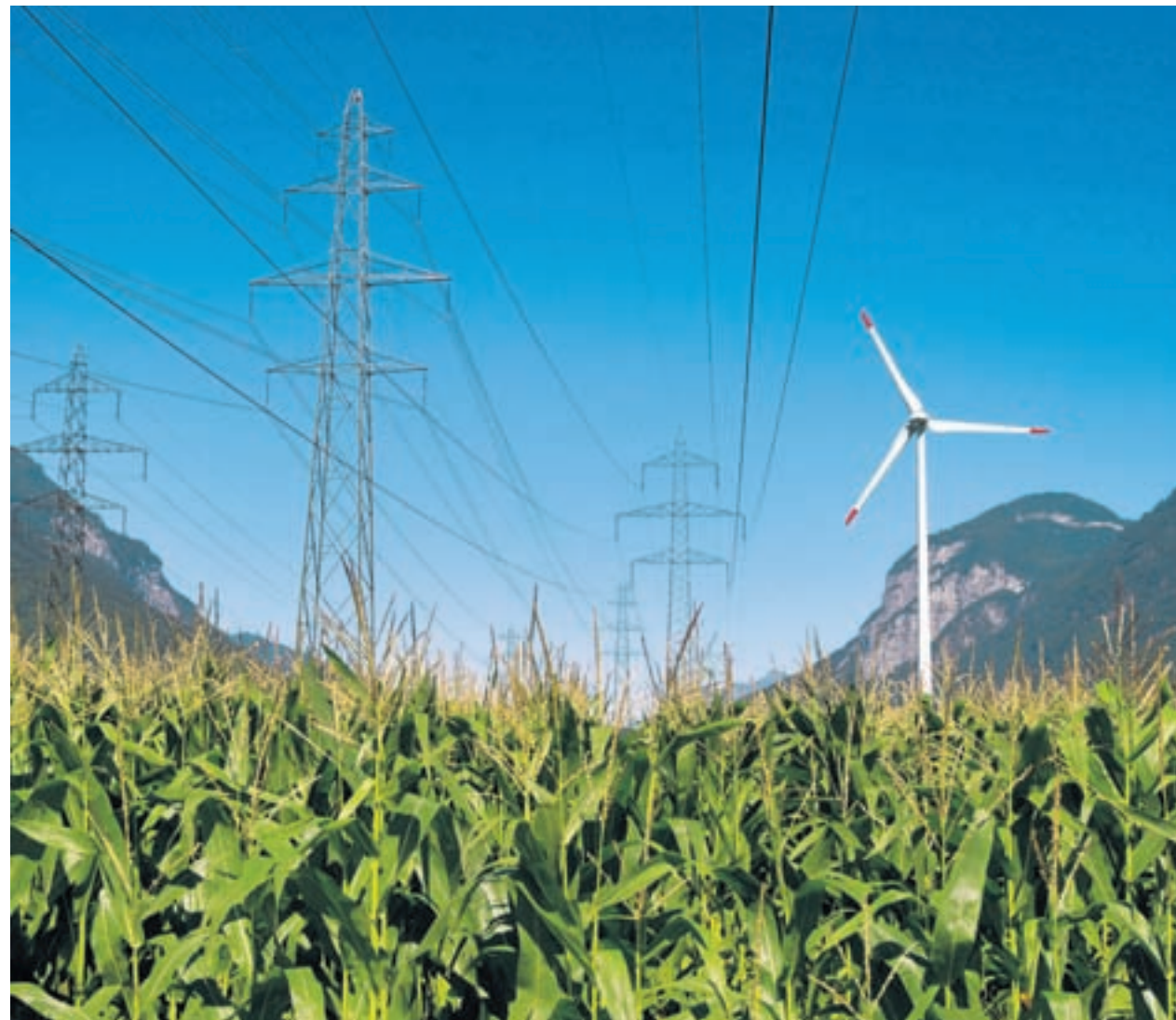
Windkraft. Selbst der viel teurere Windstrom wird von den Kunden vermehrt bestellt (Bild aus dem Wallis).

Bei Energieversorgern der Region ist die Nachfrage gestiegen