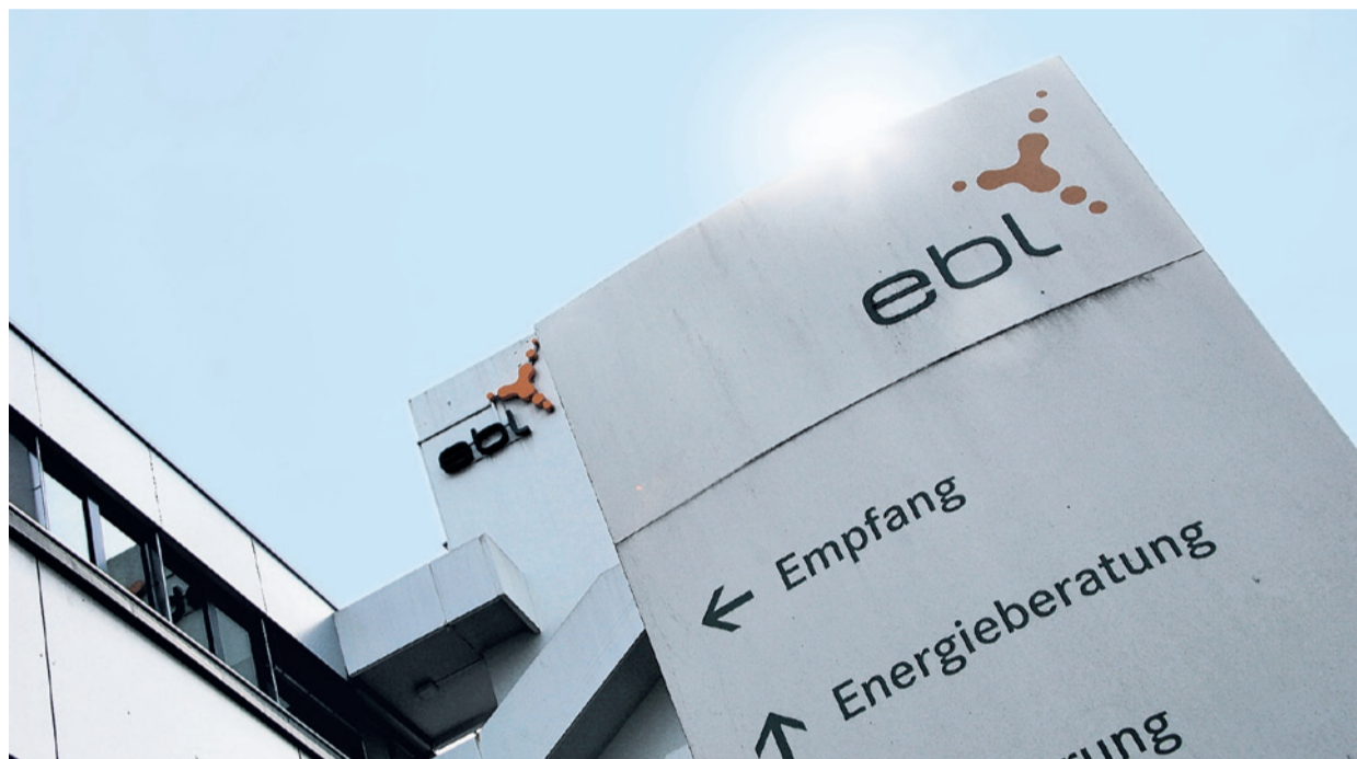
Die EBL will künftig noch mehr auf die Kraft der Sonne und andere Alternativen setzen.

Die EBL will nun in ein breites Spektrum an alternativen Energien investieren. «In Wind, Sonne, Kleinkraftwerke auf Hausdächern, Biomasse sowie mittel- bis langfristig auch in Geothermie», sagt Steiner. Ihre 7-prozentige Beteiligung am AKW-Betreiber Alpiq will die EBL aber nicht abtosseln – aus triftigem Grund: «Die Dividenden